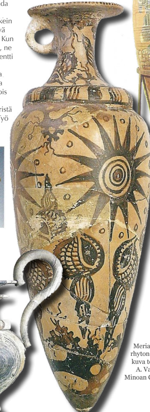
Meriaiheinen rhyton-ruukku, kuva teoksesta A. Vasilakis Minoan Crete, 1999