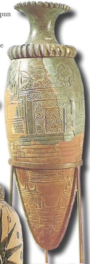
Rhyton-ruukun kuvituksena vuorenhuipun tempelialue, kuva Hannibal, teoksessa C. Davaras East Crete