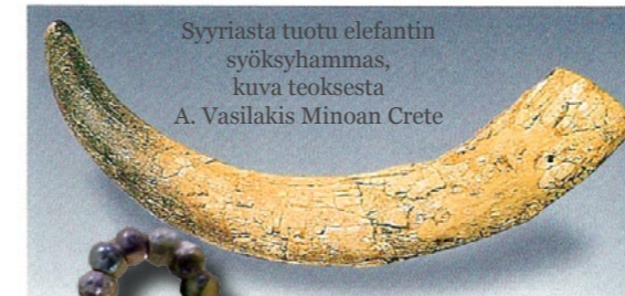
Syyriasta tuotu elefantin syöksyhammas