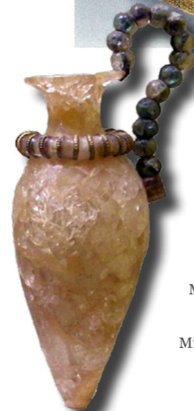
Vuorikristalliruukku, Iraklionin Arkeologinen museo