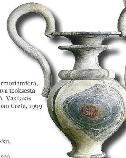
Marmoriamfora, kuva teoksesta A. Vasilakis Minoan Crete, 1999